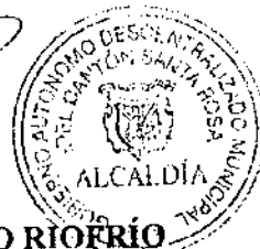
ING. CLEMENTE BRAVO RIVERO ALCALDE GOBIERNO AUTÓNOMO DESCENTRALIZADO MUNICIPAL DE SANTA ROSA