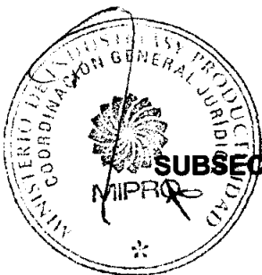
ECO. ALEXIS DIMITRI VALENCIA MORENO SUBSECRETARIO DE DESARROLLO INDUSTRIAL DEL MINISTERIO DE INDUSTRIAS Y PRODUCTIVIDAD

Dado en la ciudad de Quito D.M a, 12 NOV. 2013